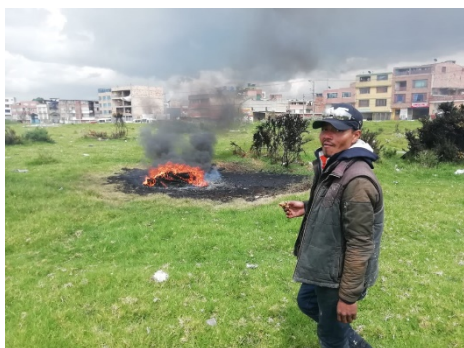
Fotografía 1. Quema en flagrancia