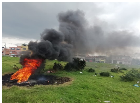
Fotografía 2. Lugar de la quema